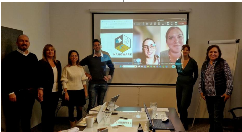
Poza - NANOWARE a3a întâlnire de lucru/ TM